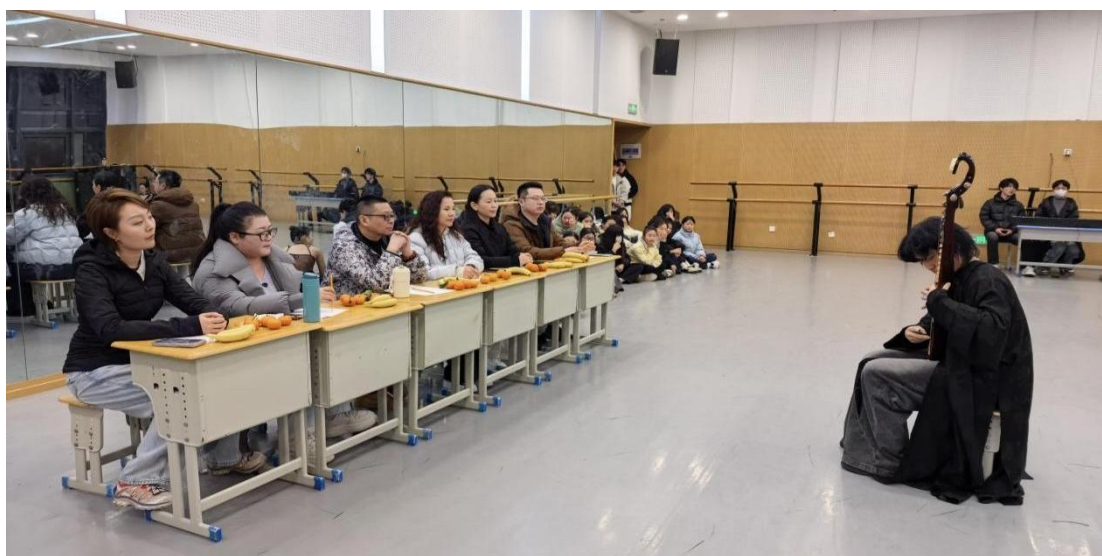
图 3-16 校园才艺大赛之琵琶独奏

菏泽艺术学校 2025 年秋季拔河运动会作为体育育人重要载体，于十月下旬在校运动场举行，以班级为单位组织参赛，实现了学生的广泛参与。