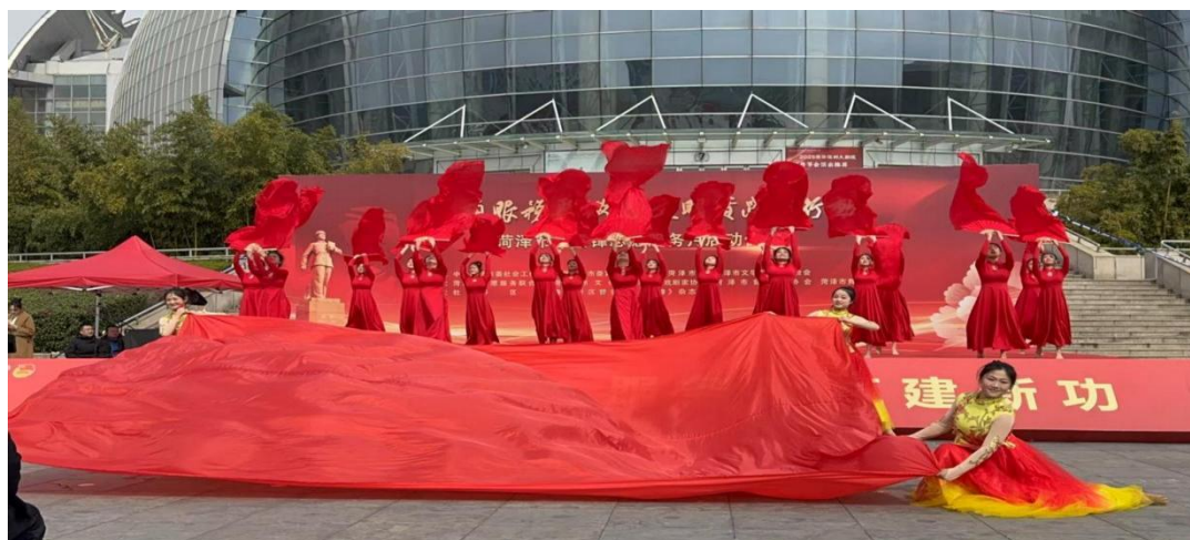
图 2-16 学生在学雷锋启动仪式上

技能，增强了社会责任感和职业认同感，为培养德技并修的高素质艺术人才积累了宝贵经验。