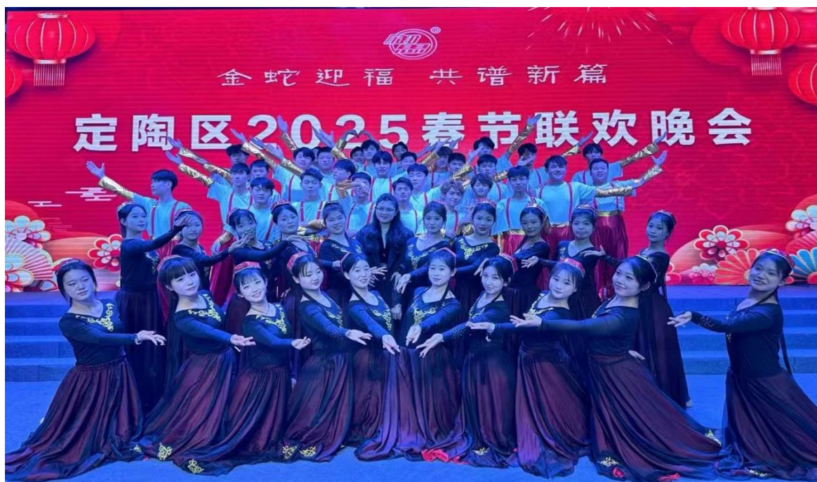
图 5-1 学生参加菏泽市定陶区 2025 年春节联欢晚会