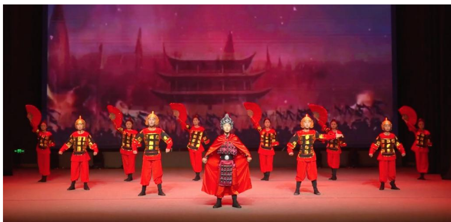
图 2-11 戏曲专业学生实习演出《满江红》课本剧

一年来，通过调研和考察，山东省菏泽艺术学校先后与郓城水浒好汉城、菏泽市地方戏曲传承研究院、菏泽市牡丹区马派文艺演出中心等单位达成实习实训意向，为学生实习提供了更多更好的岗位实习的平台，为学生就业和发展提供了机会。