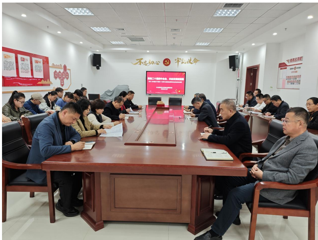
图 6-4 组织党员集中学习二十届四中全会公报

为深入贯彻落实二十大报告中关于教育的重要论述，学校组织全体教师深入学习二十大、二十届四中全会精神，职业教育新政策，深入领会其精神实质。