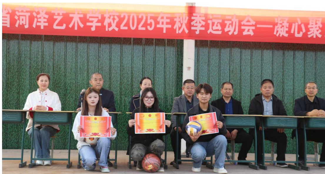
图 3-17 菏泽艺术学校 2025 年秋季拔河运动会

其规范有序的组织与热烈团结的氛围，充分体现了学校“五育并举”的育人方针，是构建积极向上、充满活力的校园文化的重要组成部分。