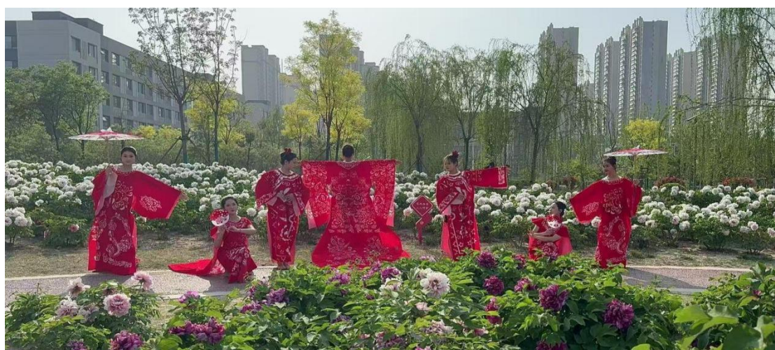
图 3-12 剪纸作品校内展示

以此为基础，山东省菏泽艺术学校组织学生走进养老院与荣军医院，开展“剪纸传温情”主题慰问活动。学生们现场展示技艺，并将精心创作的“福寿康宁”、“荣光岁月”等主题剪纸作品赠予长者与荣军。活动超越了技艺展示，成为一场温暖的代际对话与人文关怀实践。老人们在互动中追忆传统，学生们在服务中深化认同，剪纸化作连接情感的纽带，使非遗技艺从课堂知识生动转化为服务社会、传递敬意的文化行动，切实增强