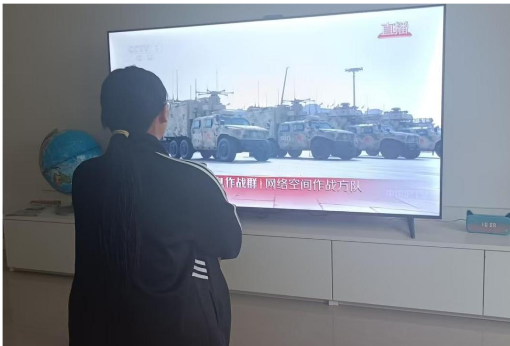
图 3-3 学生观看九三阅兵盛典