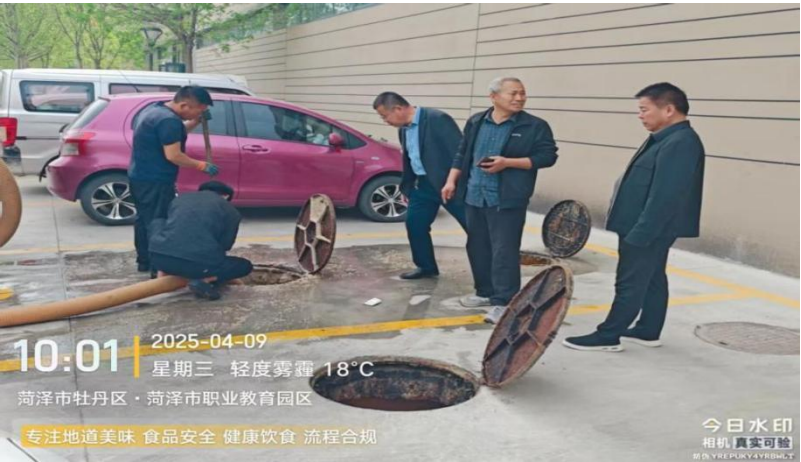
图 2-5 开展下水道疏通、化粪池清理专项活动

学校深刻认识到师资队伍是提升教学质量的核心与关键，始终将师资队伍建设作为学校发展的重中之重。为了打破师资瓶颈，学校采取了灵活多样的引才策略。