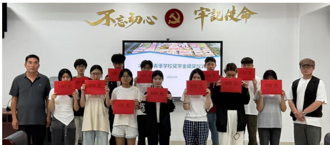
图 2-9 2025 年春季校级奖学金颁奖仪式

与此同时，学校着力优化精准资助服务，筑牢公平资助防线。秉持“公平、公正、公开”的资助原则，学校聚焦“精准”核心，完善家庭经济困难学生帮扶体系，实时更新学生家庭经济状况，确保资助对象精准识别。另一方面，进一步规范奖学金、助学金评审流程，明确申请条件、评审标准、公示期限，设立评审监督小组，开通异议反馈渠道，全程接受师生监督，确保每一笔资助金都用在刀刃上。精准资助体系的完善，有效缓解了困难学生的经济压力，保障了学生平等受教育的权利，让学生能够安心求学、专注成长。