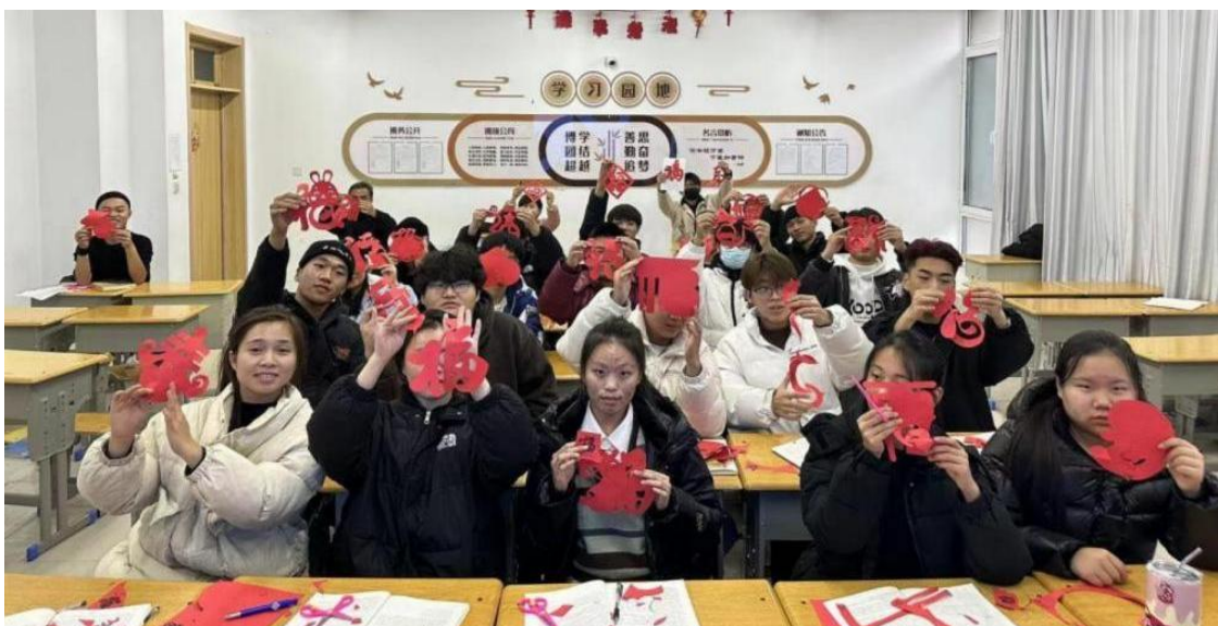
图 3-7 学生在中秋传统节日剪“福”体验剪纸文化