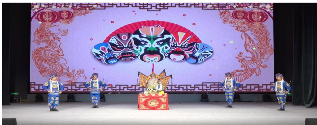
图 1-9 2022 级李广庆同学在巨野县山东梆子剧团演出剧照

剧团，成为剧团新生代演员。他较快融入剧团演出体系，已在多场下乡惠民演出中担任角色，获得观众与剧团认可，实现了从在校学习到职业演员的无缝衔接，实现了个人职业发展与地方文化事业振兴的双赢，凸显了职业教育在弘扬传统文化、促进高质量就业中的重要作用。