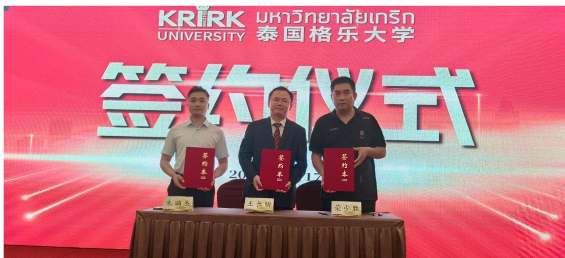
图 4-2 与泰国格乐大学签署交流备忘录

此次签约仪式示范了地方性中职院校如何通过一份精心设计的协议，将国际合作落实。它表明，成功的国际合作不仅依赖于热情接待，更依赖于前瞻性的规划与制度性保障。此模式具有高度的可推广性，任何职业院校在开展国际合作时，均可参考“从广泛接触，到聚焦议题，再到签署框架协议”这一流程，从而确保合作项目的稳定性与可持续性。