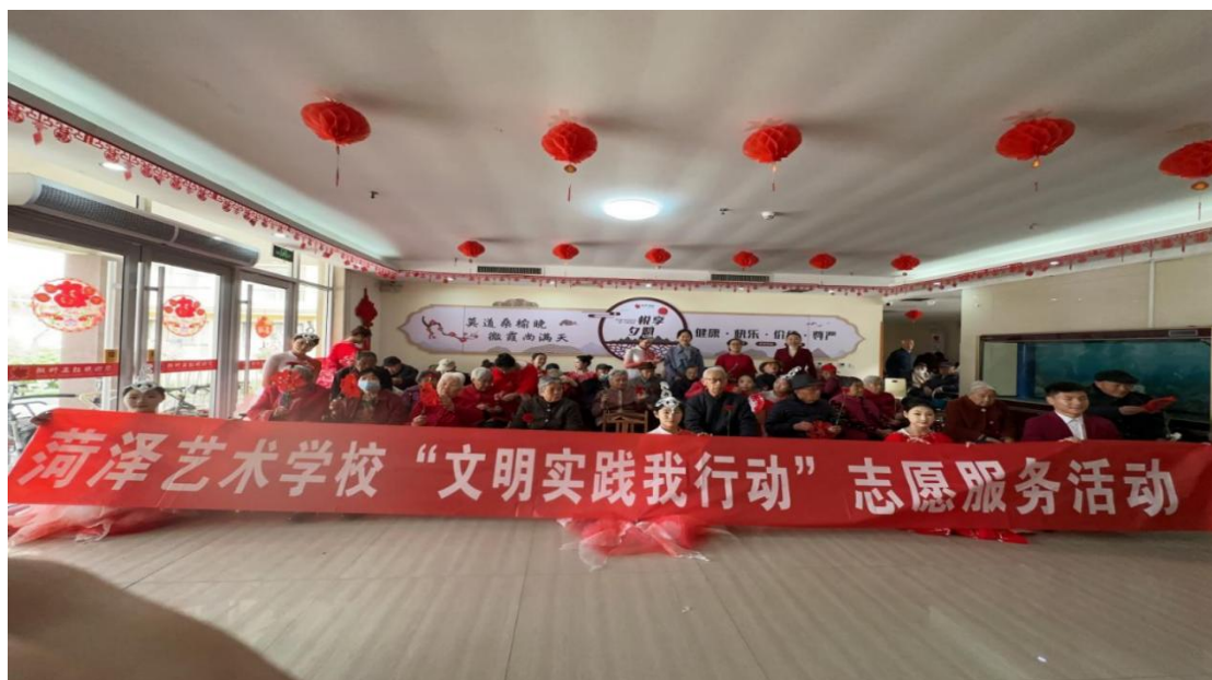
图 1-4 社区志愿服务

组织志愿活动 50 余次，服务时长超 1000 小时，同时，组织“未来工匠”技能比拼、校园艺术节等 8 场赛事活动，严格执行职业道德考核标准，指导班主任在班级内开展赛前德育教育，参赛学生展现的敬业态度与协作精神获评委高度认可。