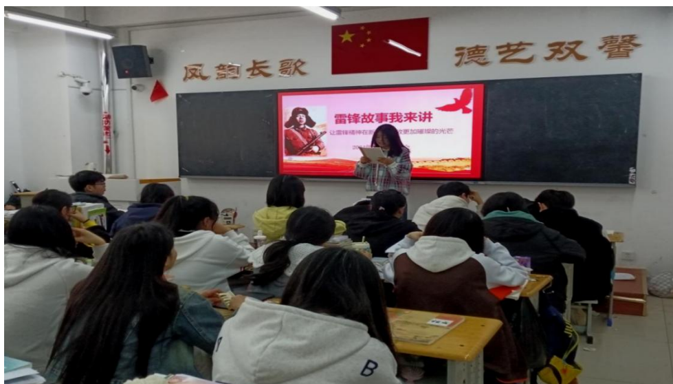
图 1-1 班主任组建校级“学雷锋宣讲团”班级宣讲

批次开展沉浸式研学；统筹班主任组建校级“学雷锋宣讲团”；指导学生将红色故事转化为戏曲身段表演、红色主题舞蹈等艺术作品；牵头举办“党史小故事”班级展演、红色主题文创设计大赛等活动 12 场，评选表彰优秀班级与个人，其中舞蹈专业班级编排的黄河文化主题《大河汤汤》舞蹈表演作品获校级德育成果奖。同时，学校协调非遗传承人进校园，开设牡丹剪纸、戏曲脸谱绘制等非遗体验课程，督导班主任组织学生全员参与，有效厚植学生文化自信与工匠精神。