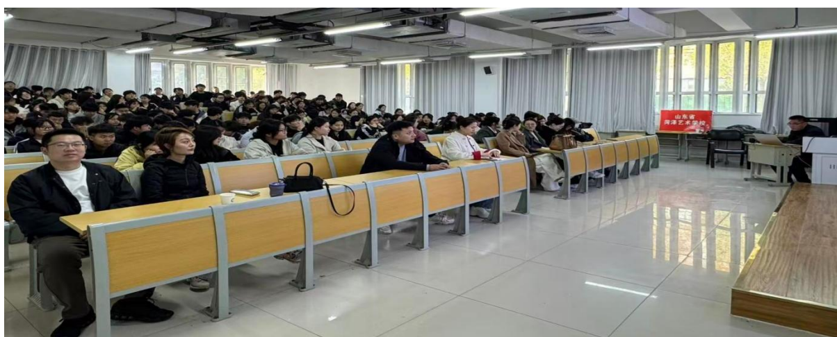
图 2-18 召开高考招生政策解读

为满足学生的升学需求，山东省菏泽艺术学校构建了“专业强化+文化课并重”的备考支持体系，组建经验丰富的专业课及文化课教学团队，科学规划复习进度，采用分层教学、个性化辅导等方式针对性提升学生应试水平；同时，山东省菏泽艺术学校提供全面的升学政策解读、志愿填报指导与心理疏导，组织学生统一完成 2026 年毕业生照片采集、高考报名、信息填报等工作，以降低学生高考报名出错率，为 2026 年学生的顺利高考奠定基础。