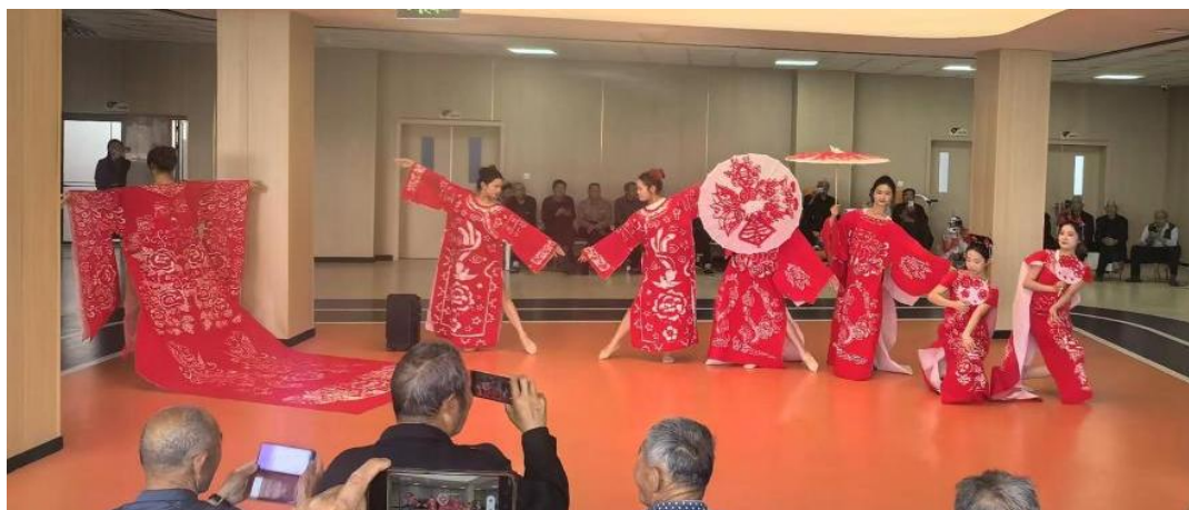
图 3-13 剪纸作品展示走进荣军医院