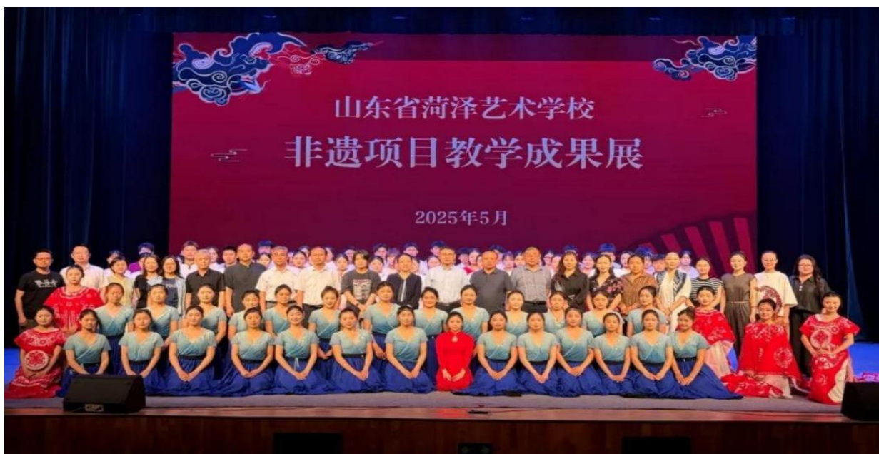
图 3-8 非遗项目教学成果参与师生展大合影

山东省菏泽艺术学校通过将非遗文化赋能课堂和成果展示相结合的方式，一方面检验了专业教师的教学成效，锤炼了文艺精品创作能力；另一方面，形成了非遗教学与实践融合的有效路径，成功构建“课堂教学+成果展示”的非遗传承模式，为职业院校挖掘地方文化资源、推进传统文化进校园提供可复制经验，助力中华优秀传统文化在青年群体中传承发展。