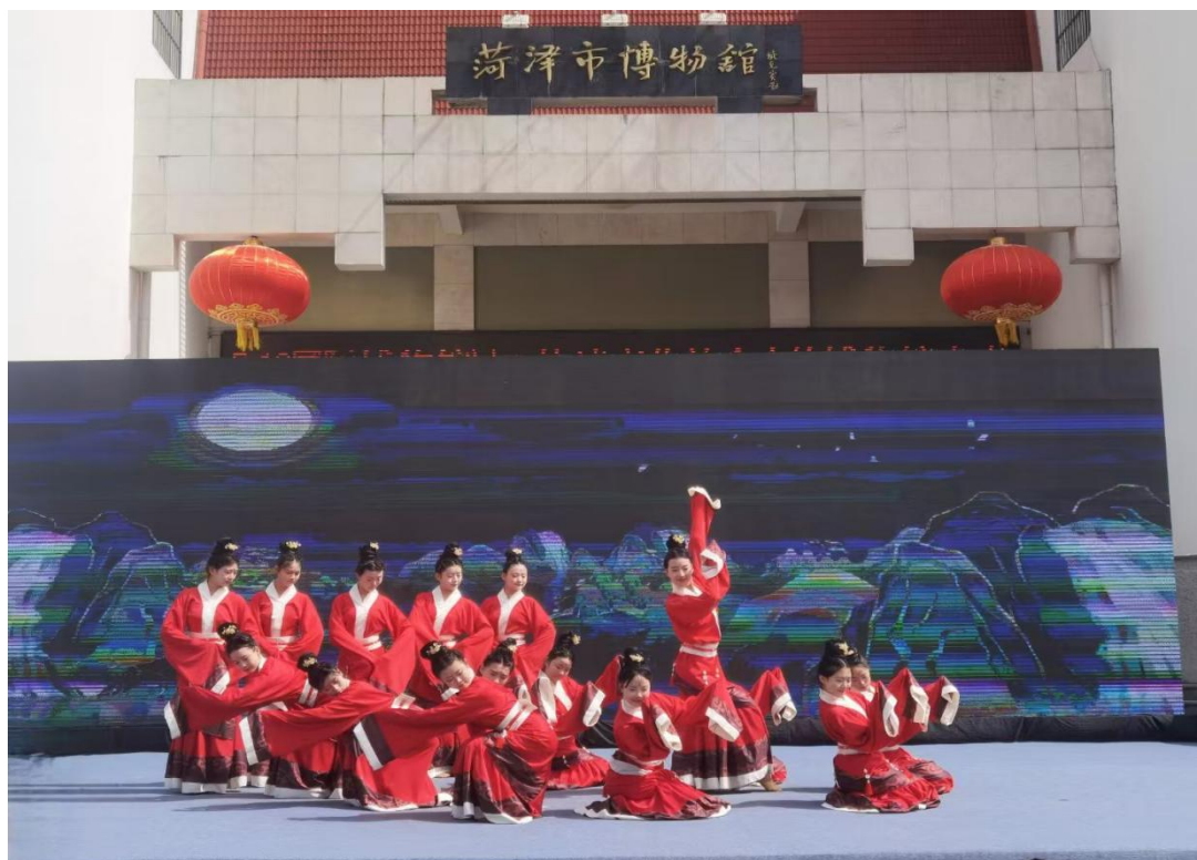
图 2-15 2025 年 5 月 17 日博物馆日，舞蹈《俑·新生》