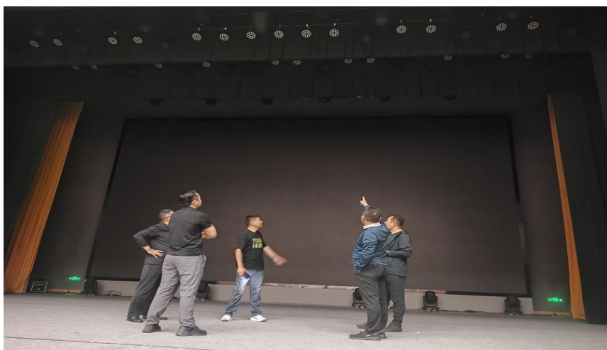
图 2-4 对剧场灯光线路进行维修保养

加强日程监管，全年完成校园水电、消防设施检查 52 次；对电梯井和配电室电缆沟防水做进一步维修；对饮水机进行了全部检查及更换滤芯。推进校园环境精细化整治，定期开展公共区域全面消杀及食堂专项消杀、有害生物防治，全年完成下水道疏通、化粪池清理等专项维护 10 次，保障校园环境整洁卫生。强化日常服务响应，建立“师生诉求快速处理通道”，接到水电维修、设施故障等反馈后及时响应处置，全年完成各类维修服务 40 余次。同步规范规范物资采购流程、物资领用、设备管理流程，建立后勤设施登记档案，实现资产全生命周期追溯管理，提升资源使用效率。