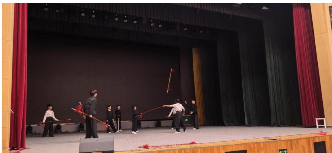
图 5-4 双师型教师排练现场

“双师型”教师是职业教育高质量发展的核心力量，兼具扎实理论功底与丰富实践经验，既能讲授专业课程、指导实践教学，也能助力学生知识积累、人格塑造及职业规划。 2025 年，学校高度重视双师队伍建设，严格对标省级认定标准，通过组织专项培训、开展材料审核、提供政策解读与技术支持等举措，为教师打造良好申报环境。经层层筛选评审， 14 名教师顺利通过“双师型”教师资格认定，数量与质量均创历史新高，显著增强了学校“双师双能”教学团队实力，有效优化师资结构，为专业教学质量提升注入强劲动力，推动学校师资建设迈上新台阶。