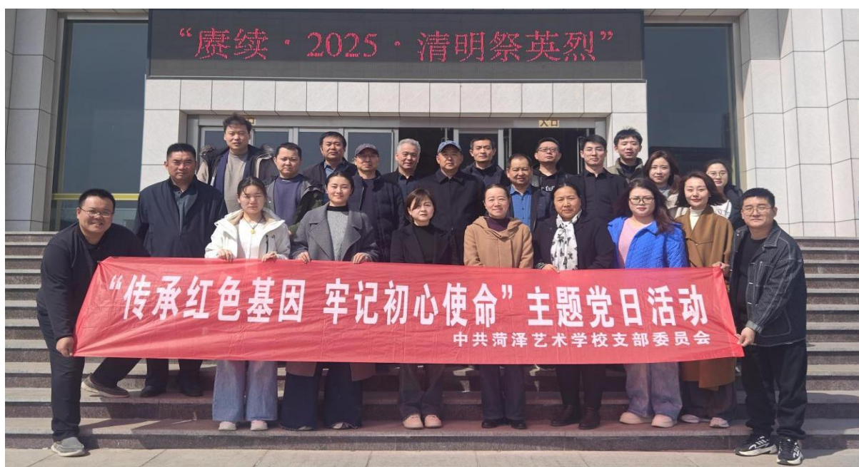
图 6-1 开展“传承红色基因 牢记初心使命”主题党日活动。

山东省菏泽艺术学校始终树牢“四个意识”，坚定“四个自信”，做到“两个维护”，强化理论武装，及时跟进学习习近平总书记最新重要讲话精神和党中央决策部署，深入推进学习习近平总书记关于教育、文化思想重要论述和重要批示指示精神，深化学思践悟，不断擦亮“红心向党”党建品牌。本年度，组织党员干部前往菏泽监狱开展警示教育，前往冀鲁豫边区革命纪念馆、菏泽市档案馆、菏泽市李荣海美术馆等单位开展主题党日活动，活动内容形式较往年有了较大变化。