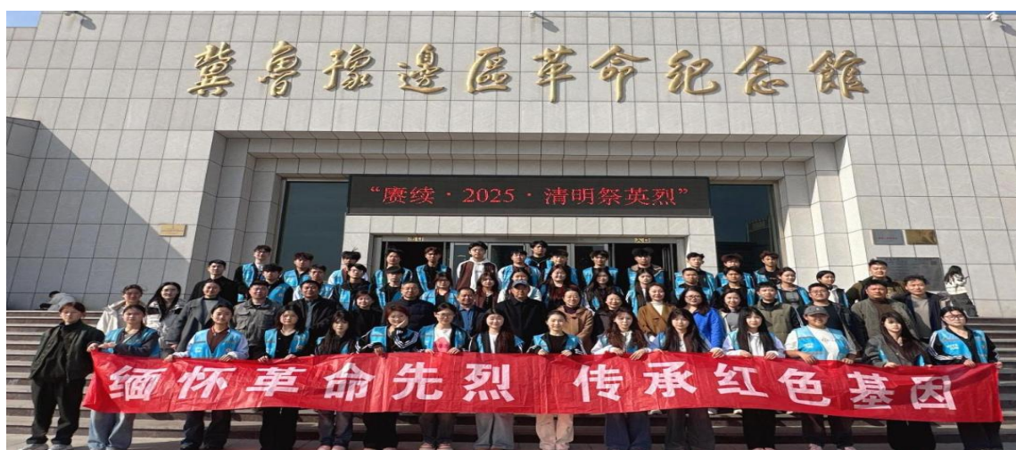
图 3-1 学校学生到冀鲁豫边区革命纪念馆缅怀先烈活动

清明时节，弘扬爱国主义精神，践行社会主义核心价值观。菏泽艺术学校师生来到冀鲁豫边区革命纪念馆，开展以“缅怀革命先烈，传承红色基因”为主题的革命传统教育。师生们目睹了革命先烈们为了民族独立和人民解放，不惜抛头颅、洒热血的壮烈场景。从革命历史年代的细节中感悟初心与使命，感悟红色精神，触摸历史文脉。