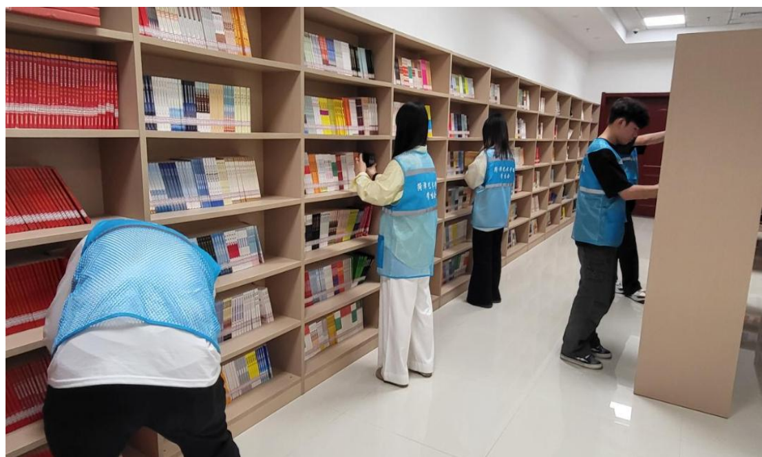
图 1-5 学校志愿服务