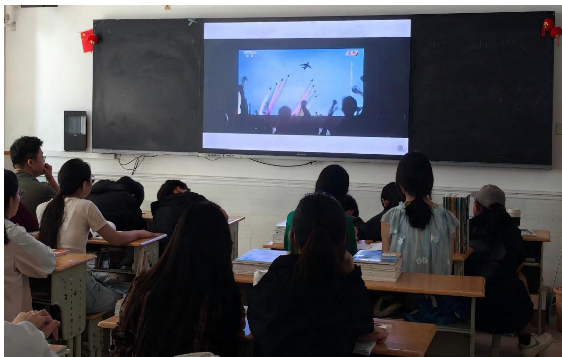
图 3-2 组织学生观看电影《我和我的祖国》

学校组织学生观看影片《我和我的祖国》，感悟新中国成立 70 周年以来的七个重要历史瞬间，影片展现了国家发展历程中的辉煌成就与普通人对祖国的深厚情感，切实丰富学生精神文化生活。直观感受影片中鲜活生动的人物形象，将个人命运与国家发展紧密相连，既有历史厚度，又有情感温度，让学生深刻感悟到今日幸福生活的珍贵，更感受到中国共产党带领人民走向胜利的强大力量。