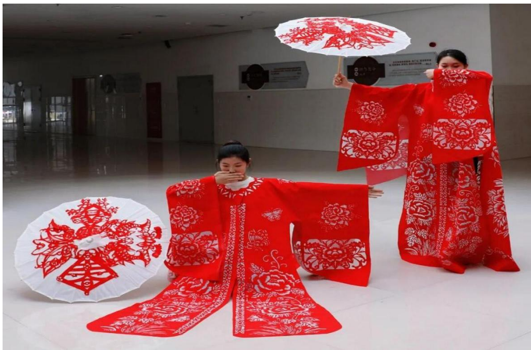
图 1-3 牡丹剪纸课程作品