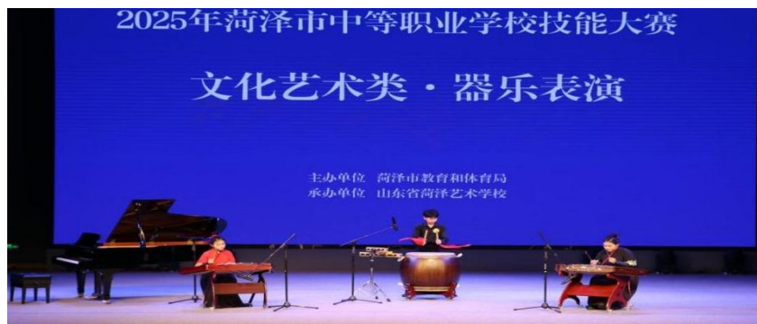
图 1-11 职业技能大赛节目扬琴合奏《将军令》

与此同时，山东省菏泽艺术学校高度重视并系统组织学生参与各级职业技能大赛。凭借雄厚的师资力量和长期的技能积累，学生在“黄炎培职业教育创新创业大赛”等权威赛事中屡创佳绩。这些大赛荣誉不仅锤炼了学生的实战能力，更直接转化为宝贵的升学优势，对于选择直接就业的学生，大赛经历和获奖成绩则成为其专业水平最亮眼的“名片”，帮助他们在各级文艺院团、文化机构中赢得先机，真正实现“以赛促就”。