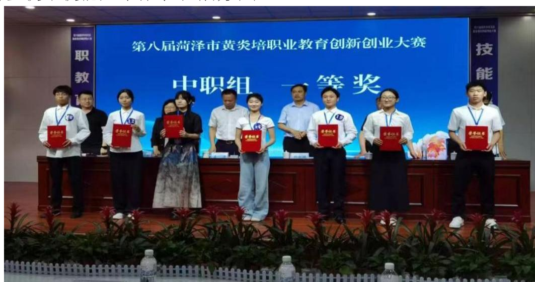
图 1-12 第八届菏泽市黄炎培职业教育创新创业大赛颁奖留念

在 2025 年 5 月举办的第八届菏泽市黄炎培职业教育创新创业大赛中，我校选送的两个项目从全市 206 个项目中脱颖而出，凭借前沿的创意与扎实的实践，均荣获中职组一等奖，山东省菏泽艺术学校荣获优秀组织奖。本次优异成绩的取得，不仅极大地激发了学生的创新潜能和创业热情，提升了其综合职业竞争力，更有力证明了艺术类中职学校在融合科技与艺术、传承与创新方面的独特优势与巨大潜力，为培养适应新时代要求的复合型、创新型技术技能人才探索了有效路径。