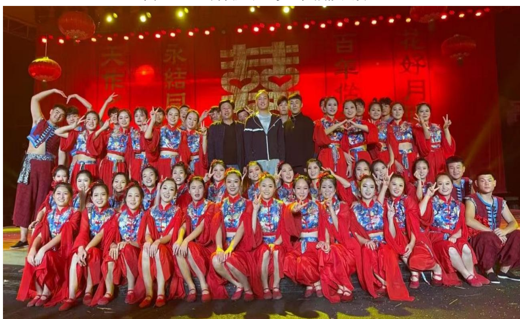
图 2-14 社会文化艺术专业学生参与大型实景剧《四季周庄》