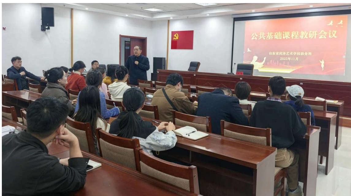
图 2-8 教务科召开教学与教务工作会议