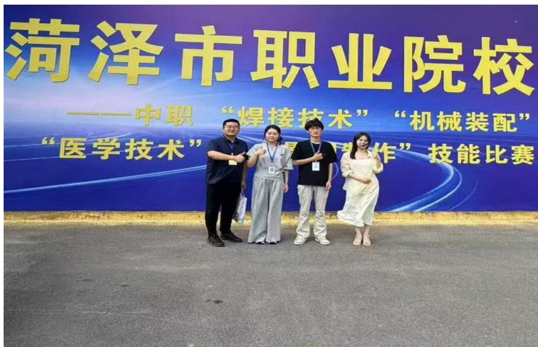
图 2-13 计算机专业学生在技能大赛