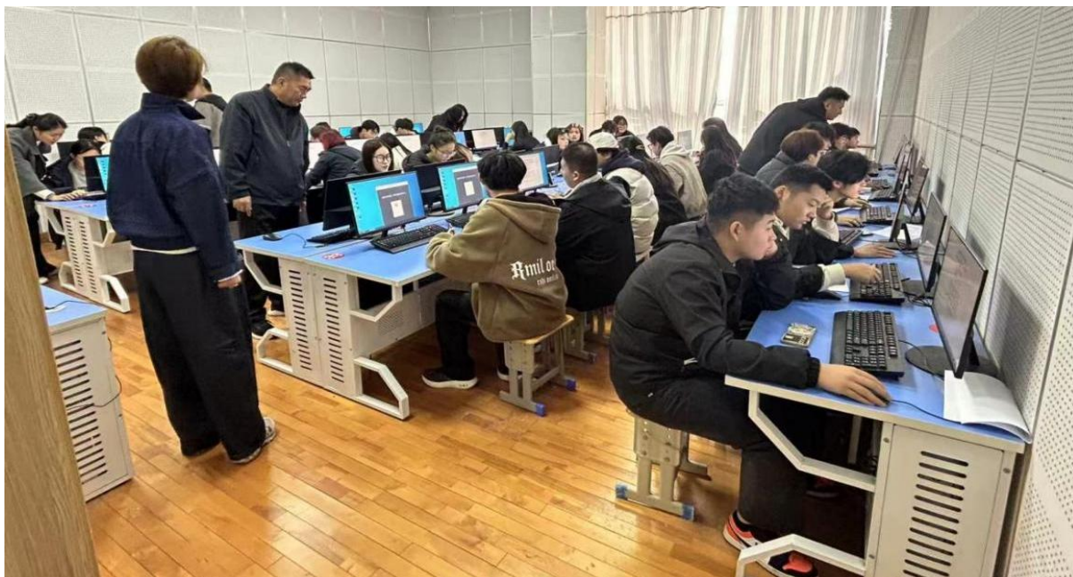
图 2-19 组织学生集体高考报名