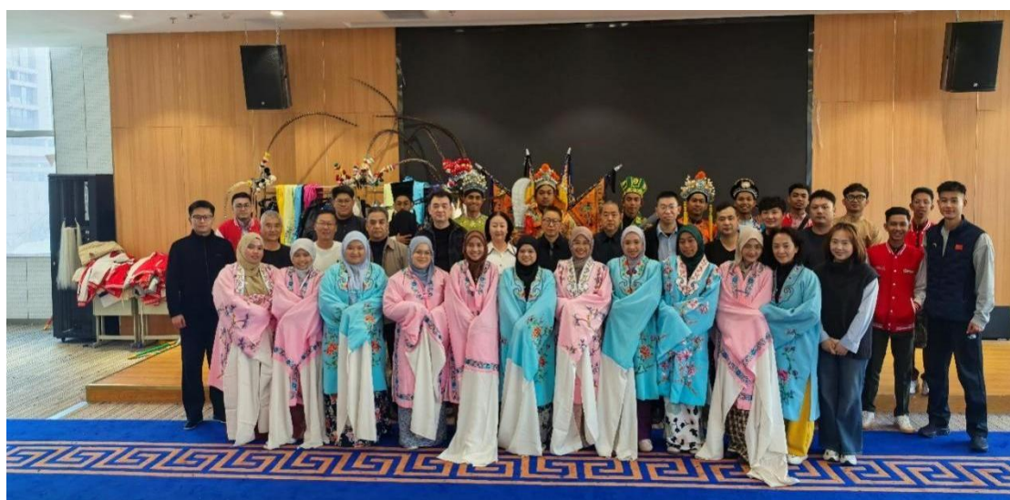
图 4-3 马来西亚农业科学大学师生体验传统戏曲服饰

此次文化体验活动为艺术类中职院校提供了一种低成本、高效率、高互动性的国际文化传播可操作范式。它证明，相较于大型演出，精心设计的、以动手体验为核心往往能产生更深刻、更个人化的国际传播效果。这种“轻量化、重体验、强互动”的模式，对专业师资和场地要求相对灵活，易于在各类职业院校中复制和推广，是推动地域特色文化国际化的有效实践工具。