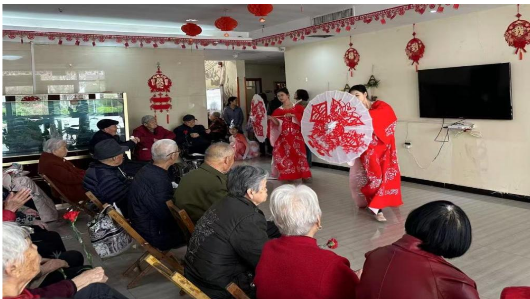
图 3-14 剪纸作品展示走进枫叶正红养老院

山东省菏泽艺术学校“青春飞扬”才艺大赛作为特色育人活动被重点呈现。本次大赛于年末举办，历时两周，覆盖声乐、器乐、舞蹈、戏剧四大门类，吸引了全校近三分之二的学生直接参与。