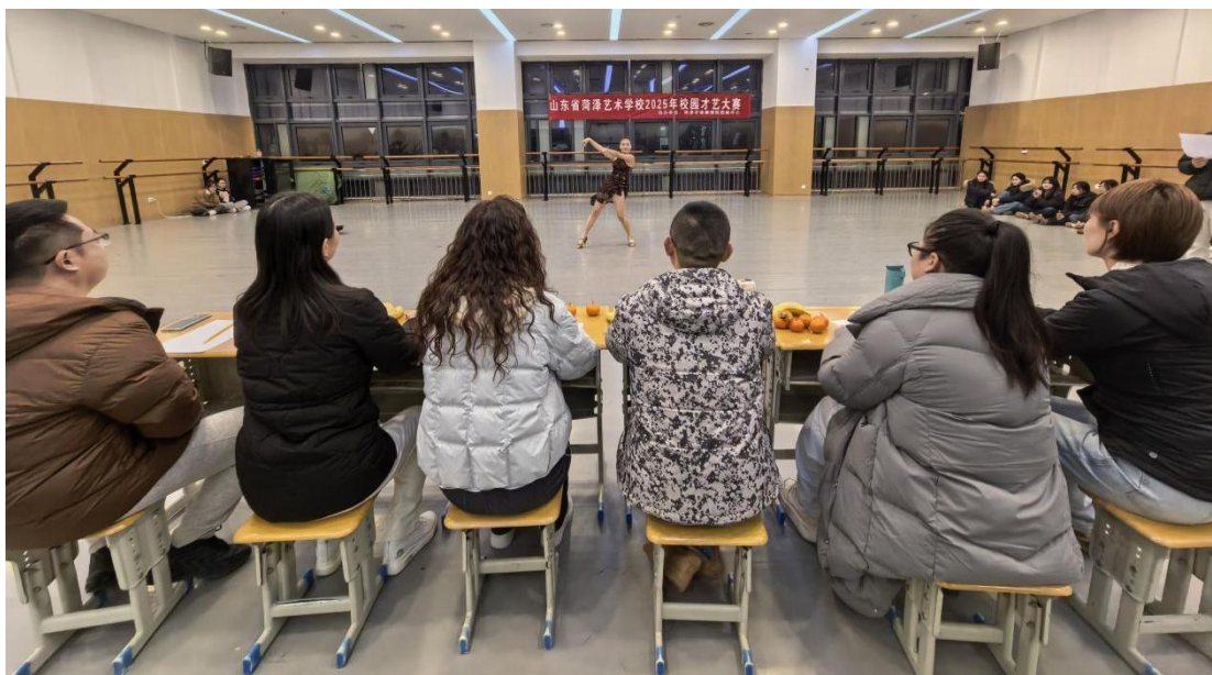
图 3-15 校园才艺大赛精彩瞬间