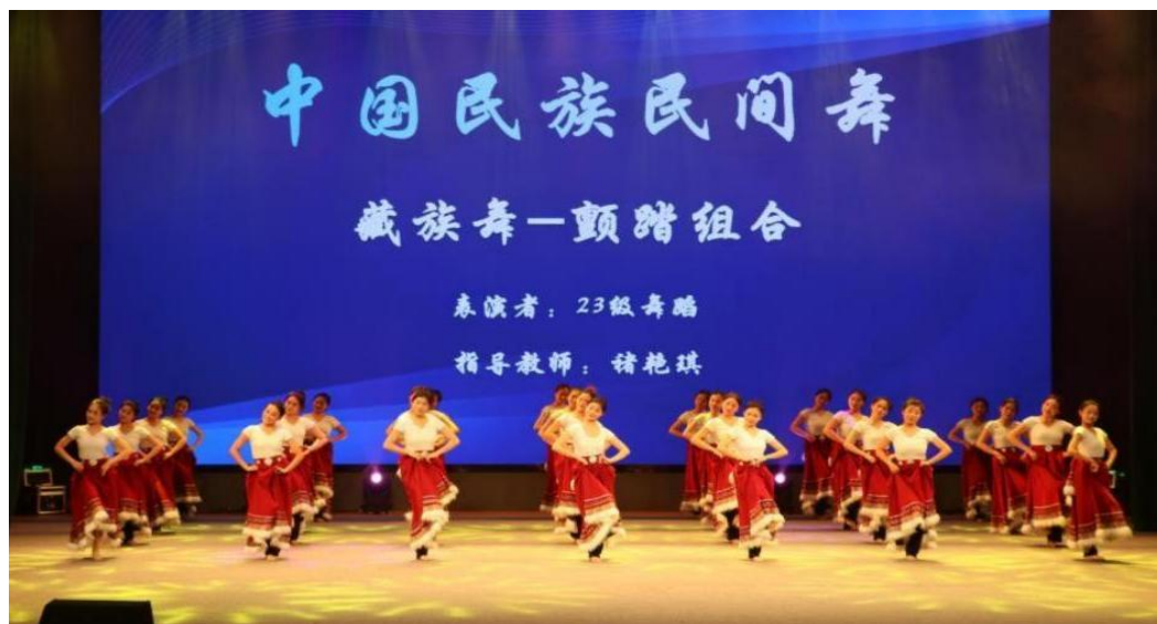
图 3-5 5 月民间舞蹈藏族舞舞台展示

该教学模式不仅锤炼学生技艺，更使典籍思想与文化符号通过肢体与情感得以具象化、立体化呈现，实现了“以文化人、以艺通心”的教学宗旨，扎实推进了传统文化在当代艺术教育中的传承与延续。