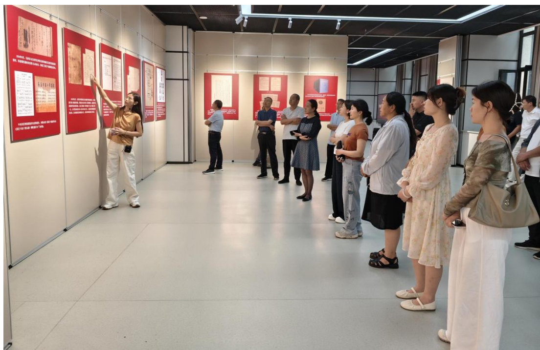
图 6-2 组织党员教师赴菏泽市档案馆参观。

通过参观学习，党员们对党的纪律建设历史有了更全面的了解，对党的纪律有了更加深刻的认识。大家纷纷表示，在今后工作中自觉做到知敬畏、存戒惧、守底线，进一步提高自身廉洁意识。