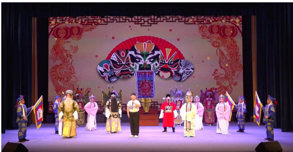
图 5-3 学生实习演出《要为职教谱新篇》非遗剧种联唱

本次戏曲联唱项目示范了如何通过一个综合性的非遗剧种联排，高效整合多个分散的地方戏曲传承资源，并将其转化为一个结构化的教学项目。它验证了“以项目整合资源、以舞台呈现教学”的模式在非遗传承教育中的可行性，有效解决了单一剧种传承面窄、教学资源分散的问题。此模式具有可复制性和推广价值，特别适用于拥有多重非遗资源的地区，为中职院校系统化、规模化地培养技能型地方戏曲后备人才，以及开展特色鲜明的社会服务，提供了明确的操作范式。