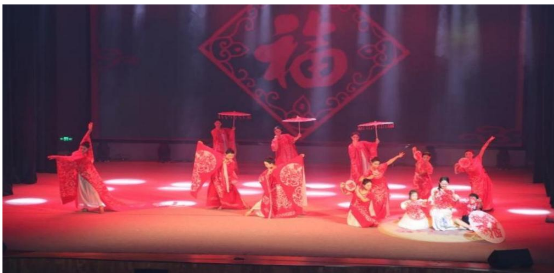
图 3-6 23 级舞蹈生在市非遗展演晚会上表演的《翩若惊鸿》

推动优秀民俗文化走进校园、融入生活等一系列举措，有效增强了学生对中华优秀传统文化的认同感与自豪感，为培育具有坚定文化自信和深厚民族情怀的新时代艺术人才奠定了坚实基础。