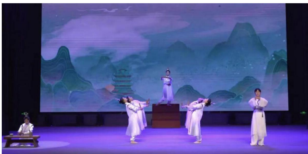
图 3-9 选送节目《儒风礼乐·大道长歌》的表演现场

2025 年，山东省菏泽艺术学校师生先后参与了“全国职业院校师生非遗工艺美术作品展”、“梨花杯”全国青少年戏曲教育教学成果展示、“第七届中华经典诵写讲大赛”、山东省中小校园文化艺术节等多项国家级、省级重要专业竞赛。在这些舞台上，师生们不仅展示了精湛的艺术技艺与扎实的专业功底，更以富有时代精神和创新意识的舞台作品，生动诠释了中华优秀传统文化的深厚底蕴与恒久魅力，通过大胆突破创新，实现了个体艺术能力提升与传统文化精神内涵传承的有机统一。这一系列“赛演并举”的实践举措，不仅提升了学生的专业竞争力与综合素养，更在创作与实践的鲜活场域中，有效推动了优秀传统文化在校园内的深度渗透与代际传承，使其真正成为滋养师生成长、引领专业发展的不竭源泉。