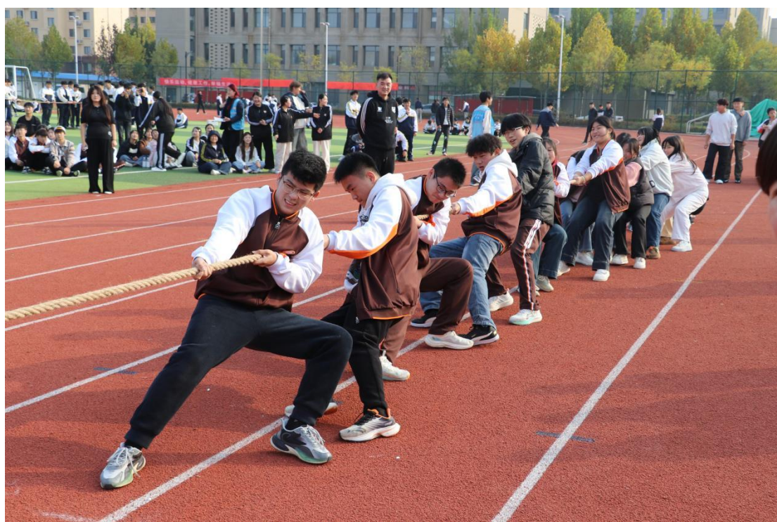
图 3-18 菏泽艺术学校 2025 年秋季拔河运动会场景