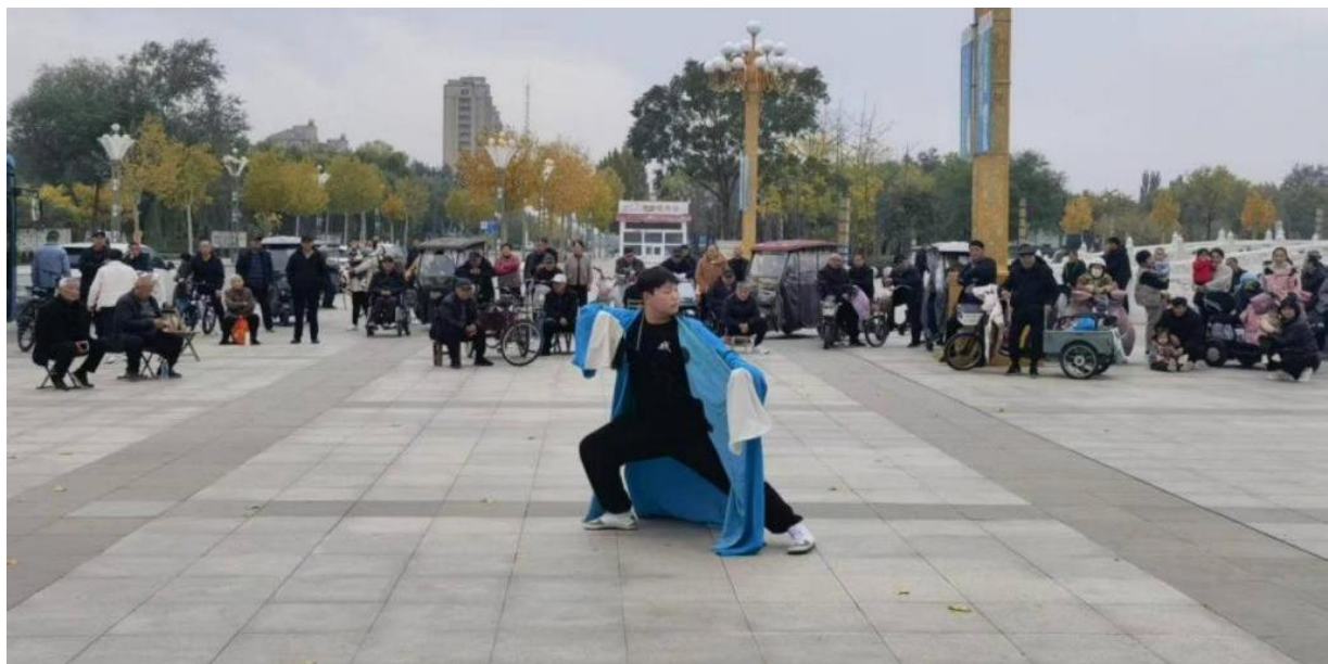
图 2-22 学生进“李峨社区”进行戏曲表演