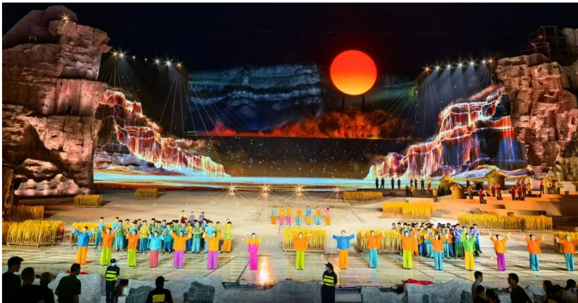
图 5-2 学生参加红旗渠精神研学舞剧《太行红日》