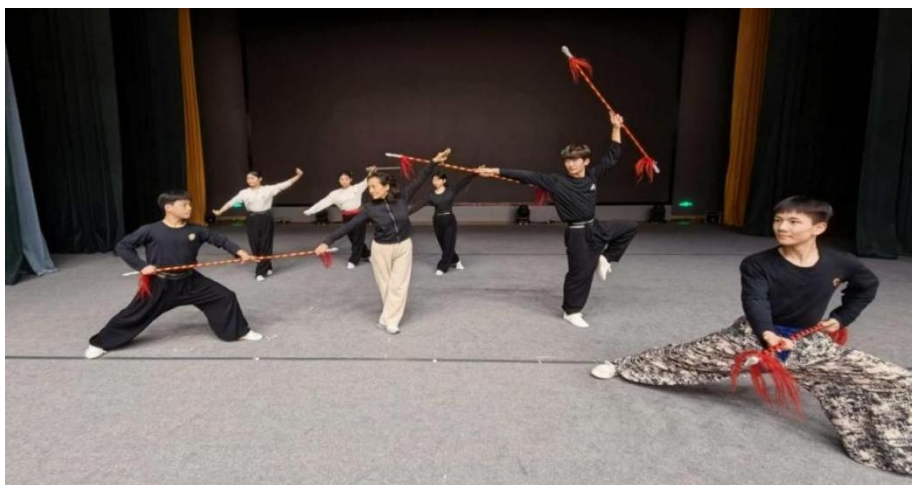
图 5-7 戏剧院团老师进校授课

依托菏泽“戏曲之乡”资源优势，学校戏曲表演专业与菏泽市地方戏曲研究与传承院深度合作，构建“校团联动、剧目驱动”的产教融合模式，让技能培养扎根行业沃土。双方共建实训基地，将课堂延伸至排练厅与舞台，实现人才培养与院团需求无缝对接。合作推行“双导师”授课制，聘请山东梆子、两夹弦等非遗传承人进校执教。以院团演出任务为实践课题，组织学生参与“送戏下乡”惠民演出在真实现场中锤炼唱腔身段。2025年，校企联合打造的山东梆子选段，助力学生斩获第五届“梨花杯”全国青少年戏曲教育教学成果展示活动佳绩。这种“课堂学技艺、剧团练本领”的模式，既传承了非遗剧种，更筑实了学生的职业根基，彰显校企共生的育人价值。