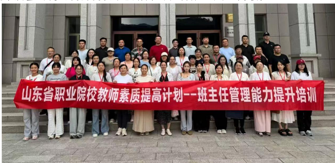
图 2-7 教师参加山东省职业院校班主任管理能力提升培训

的教师不仅具备扎实的专业知识，更拥有良好的师德师风和职业素养；在培养机制上，学校为教师搭建了多元化的成长平台，通过组织教研活动、教学竞赛、外出进修等，促进教师专业能力的持续提升；在管理机制上，学校加强了对人才的科学管理，通过建立合理的考核评价体系和激励机制，激发教师的工作热情和创新活力。通过这些机制的协同作用，学校营造了尊重人才、关爱教师的良好氛围，增强了教师的归属感和责任感，从而为教学质量的稳定提高提供了强有力的机制保证和人才支撑。