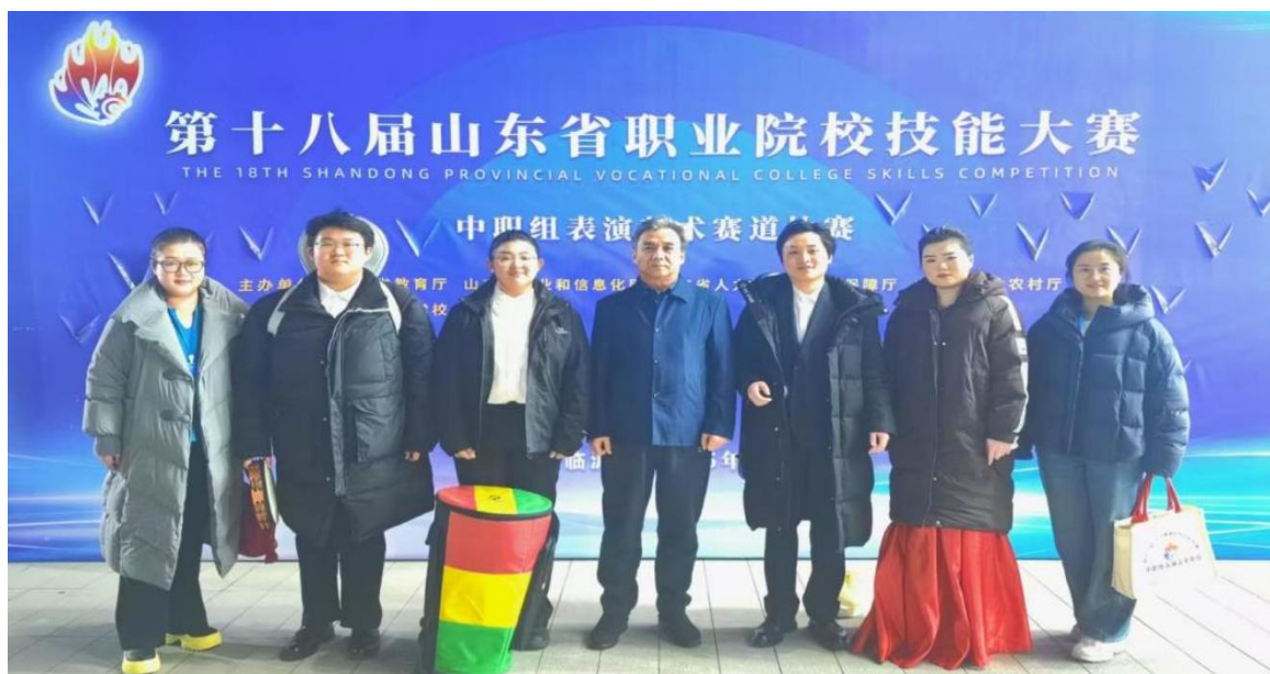
图 5-6 学生于参加第十八届山东省职业院校技能大赛

学校坚守“以服务为宗旨、以就业为导向”办学方针，深度融合校企（院）资源，构建“课程共建、人才共育、成果共享”协同育人模式。在“双师型”教师队伍支撑下，课程设置精准对接产业需求，教学过程强化实践导向，助力学生夯实理论基础、锤炼实操能力。近年来，学生技能竞赛获奖率大幅提升，对口就业率稳步走高，升学通道持续拓宽。双师教学模式的深化，为学生筑牢“升学有基础、就业有能力”双重保障，推动教学质量稳步跃升，赢得社会广泛认可。