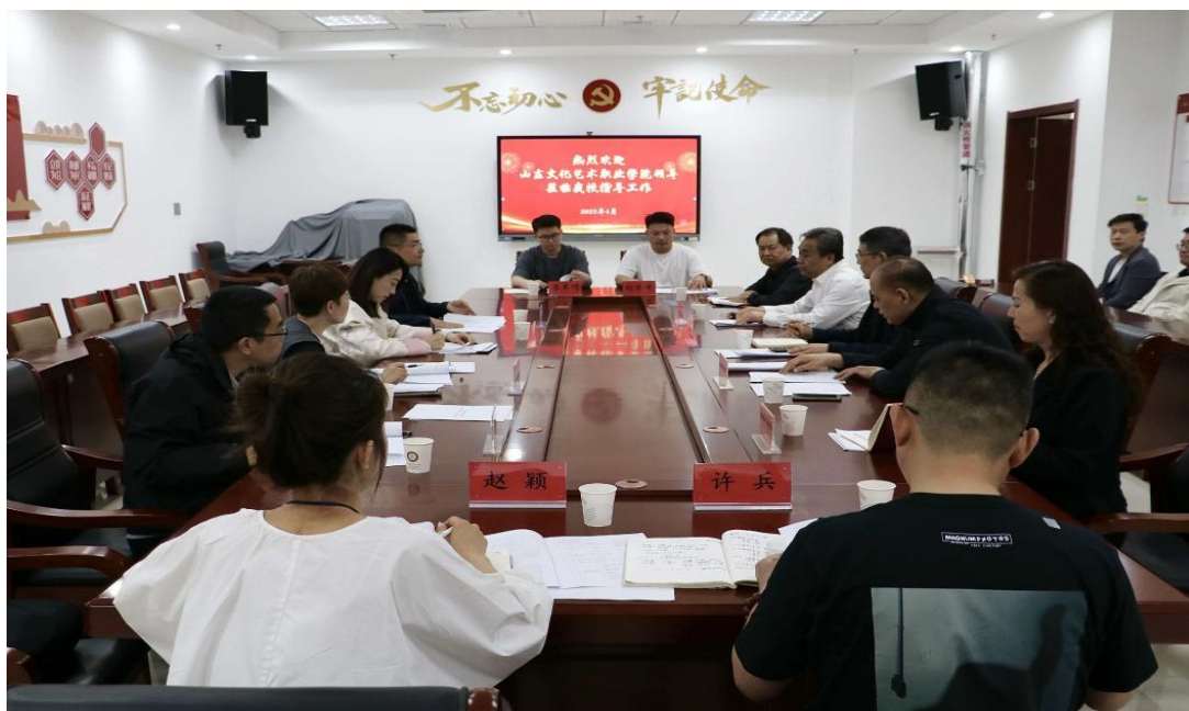
图 5-8 中高职“三二连读”工作会议

学校以“三二连读”项目为核心载体，搭建“中职—高校”贯通成长桥梁，为艺术学子构筑稳定上升通道。深化与山东文化艺术职业学院、菏泽职业学院的战略合作，针对戏曲表演、舞蹈表演、音乐表演等特色专业，共建五年一贯制培养体系，明确中职三年夯实专业基础、高职两年主攻核心技能的分段培养目标。建立课程衔接机制，将高职阶段专业核心课程前置渗透，同步推行教学标准统一、考核评价协同、师资资源共享模式，定期邀请合作高校教师到校开展专题授课与教学指导。同时完善升学保障体系，组建专项辅导团队，针对转段考核开展靶向训练，确保学生顺利衔接。这一贯通培养模式有效打破中高职教育壁垒，为艺术学子提供了循序渐进的成长路径，助力其实现专业能力的持续提升。