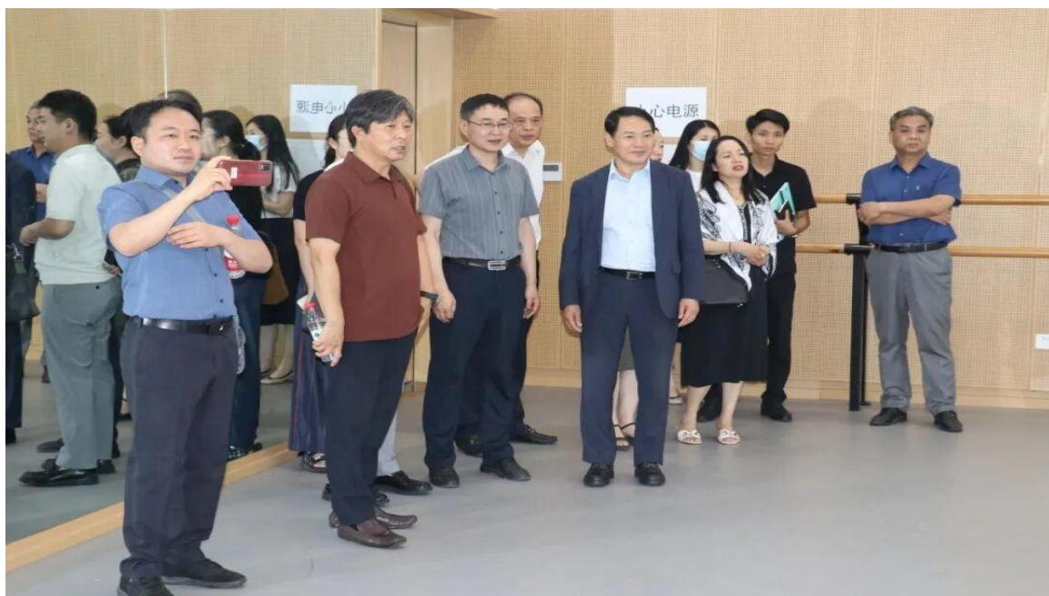
图 4-1 韩国国际文化交流院、协成大学到访参观

此次活动为资源相对有限的地区性艺术类中专学校，提供了一种低成本、高效益的国际合作启动模式。它示范了如何将一次常规的外事接待，通过聚焦专业核心内容展示转化为推动具体合作项目的杠杆。任何学校只要精准提炼自身专业亮点，均可参照此流程设计交流活动，从而有效打开国际合作局面。