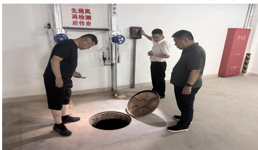
图 2-2 开展每月一次常规检查

筑牢校园安全防线，构建平安稳定校园环境。一是坚持“安全第一、预防为主”原则，推动安全管理从“排查整改”向“预防治理”转变。修订完善《校园安全管理细则》《突发事件应急处置预案》等 3 项制度，年初安装人车分离隔离栏、细化非机动车辆停放、消防通道管理等具体要求，让安全管理有章可循。二是加大重点区域排查力度，对教学楼、宿舍楼、实训楼等场所开展每月 1 次常规检查+季度专项督查，重点覆盖消防设施、水电路、安防设备等关键部位，全年整改安全隐患 12 处，对学校全部消防器材进行更换，维修老化设施 30 余处。深化安全宣传教育，开展防震疏散演练 1 次、消防安全演练 1 次、安全知识讲座 3 场，覆盖全体师生，提升了师生应急避险和自救互救能力，全年未发生各类安全责任事故。