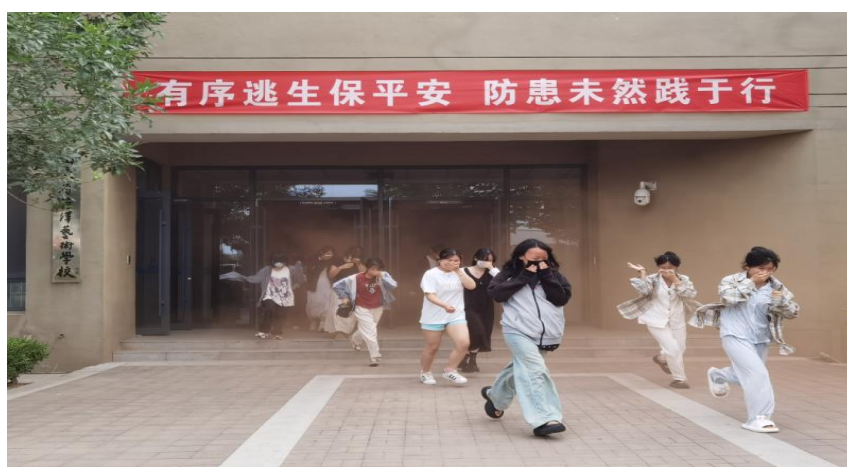
图 2-3 深化安全教育开展消防演练