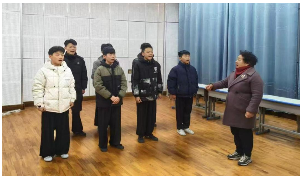
图 5-5 菏泽市戏剧传承与研究院的专家担任教学指导教师

为提升职业教育实践性与应用性，学校创新人才引进机制，整合区域资源，特聘菏泽市戏剧传承与研究院资深专家担任“双师型”教学指导教师。专家们兼具深厚行业背景与丰富舞台实践经验，将真实项目融入课堂，实现“教、学、做”一体化。学校同步建立校院合作机制，联合开发课程体系、设计实训项目、组织教学观摩，有效弥补校内教师实践教学短板，推动教学内容与行业标准精准对接，显著提升学生综合职业素养与岗位适应能力，构建起多元协同育人新生态。