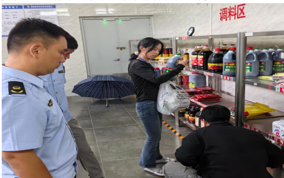
图 2-1 国家市场监督管理总局委托第三方对餐厅食材抽检

深化食堂自营建设，打造安全优质餐饮服务。一是立足食堂自营模式成熟运行基础，进一步健全食品安全治理体系。持续优化以校长为组长的食品安全领导小组工作机制，严格落实日管控、周排查、月调度制度，将食材采购、加工制作、留样存储等全流程纳入闭环管理。二是升级食材采购管理，在教育部门定点采购基础上引入供应商动态评估机制，通过公开比价、质量溯源强化管控，既保障食材安全新鲜，又实现采购成本精准控制，并通过了国家、省、区市场监管对学校食堂的抽样检查。三是强化食堂队伍建设，全年组织食品卫生、消防安全、服务礼仪等专项培训 4 次，推行“师生满意度测评”机制，根据反馈优化菜品结构、提升餐食营养搭配，同步改善食堂就餐环境，让餐饮服务更具温度。