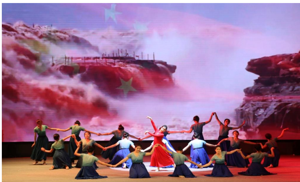
图 1-2 舞蹈专业学生编排的舞蹈作品《大河汤汤》