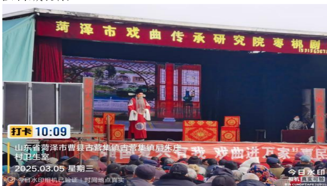
图 2-20 送戏下乡

曲进万家”惠民演出活动，让村民在家门口享受到专业演出，送戏下乡活动丰富了群众文化生活，提升了村民的生活质量和幸福感，受到了广大群众的热烈欢迎。戏曲非遗项目通过下乡演出得以活态传承，而结合政策宣传、移风易俗等主题戏曲剧目展演，也在潜移默化中引导价值观，促进乡村和谐。在送戏下乡活动中，枣梆剧团演员和朱庄村文化骨干开展互动，培训了基层文化骨干，扶持朱庄村文艺团队，形成了“送文化”与“种文化”结合的长效机制。