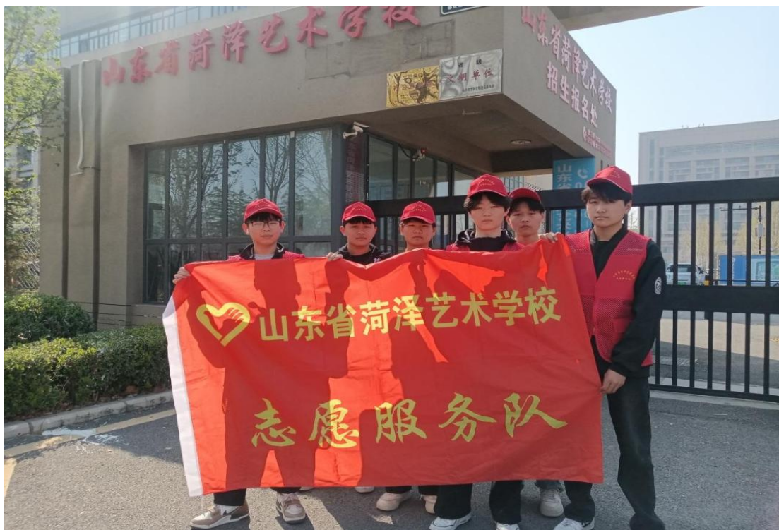
图 1-6 学生科筹备志愿服务队