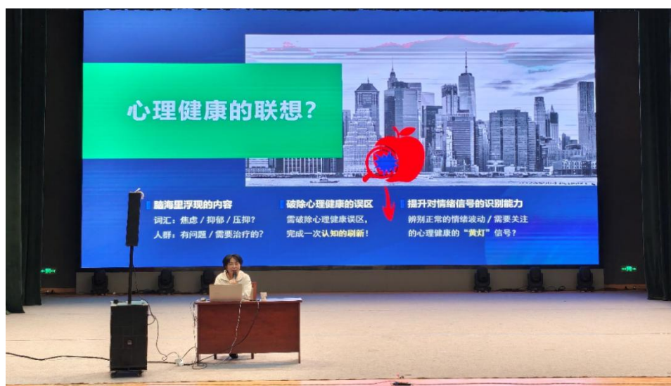
图 1-8 组织班主任参加心理健康专题培训