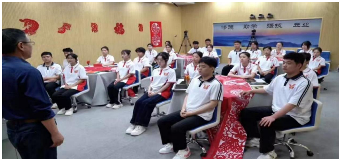
图 3-11 剪纸传统技艺课堂

向全体学生开设了常态化剪纸课程。课程不仅教授剪纸的基本技法与历史内涵，更注重引导学生在纹样设计与创作中理解其承载的文化寓意与民族情感。