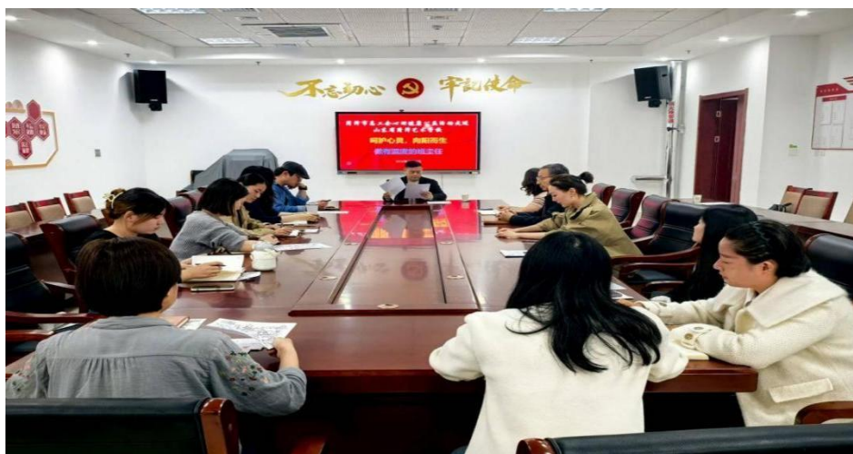
图 1-7 心理健康主题班会现场

每位班主任结对帮扶 5-8 名学生，定期开展谈心谈话并记录；全年组织班主任参加心理健康专题培训 4 场，提升班主任识别、疏导学生心理问题的能力；针对戏曲形体专业学生训练压力大的特点，联合心理教师开发“戏曲身段放松操”，指导班主任在班级内推广；组织开展“情绪管理”主题班会、户外素质拓展等活动 10 场，全年心理健康普查覆盖率达 100%，学生心理调适能力显著提升。