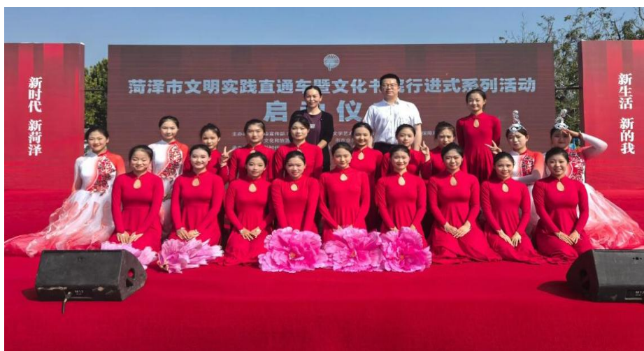
图 2-12 菏泽市文明实践活动启动仪式，歌伴舞《花开盛世》